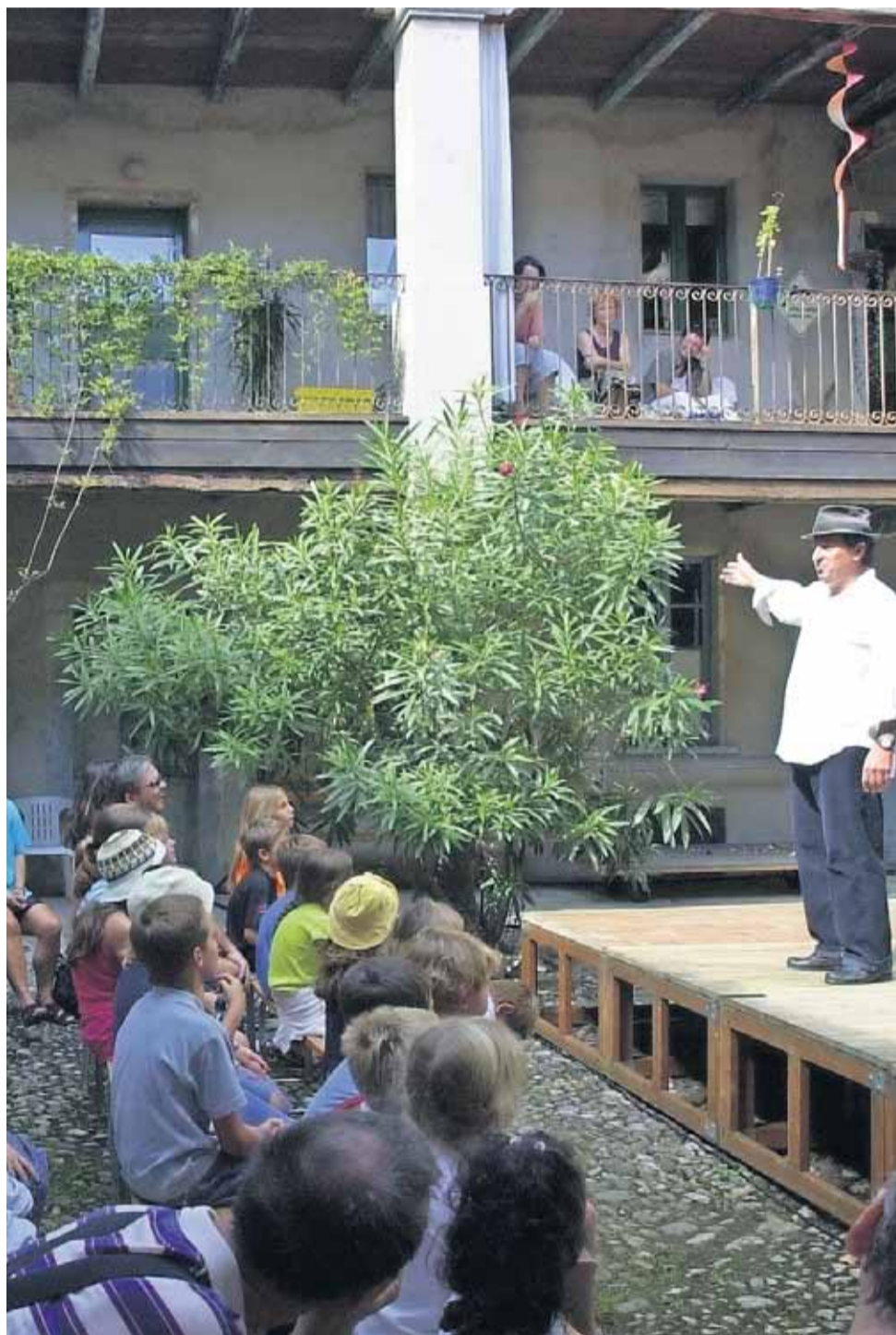
UNA SPLENDIDA CORNICE Le corti del borgo momò sono il teatro degli eventi proposti dalla kermesse. (fotogonnella)

Per ulteriori informazioni www.festivalinarrazione.ch